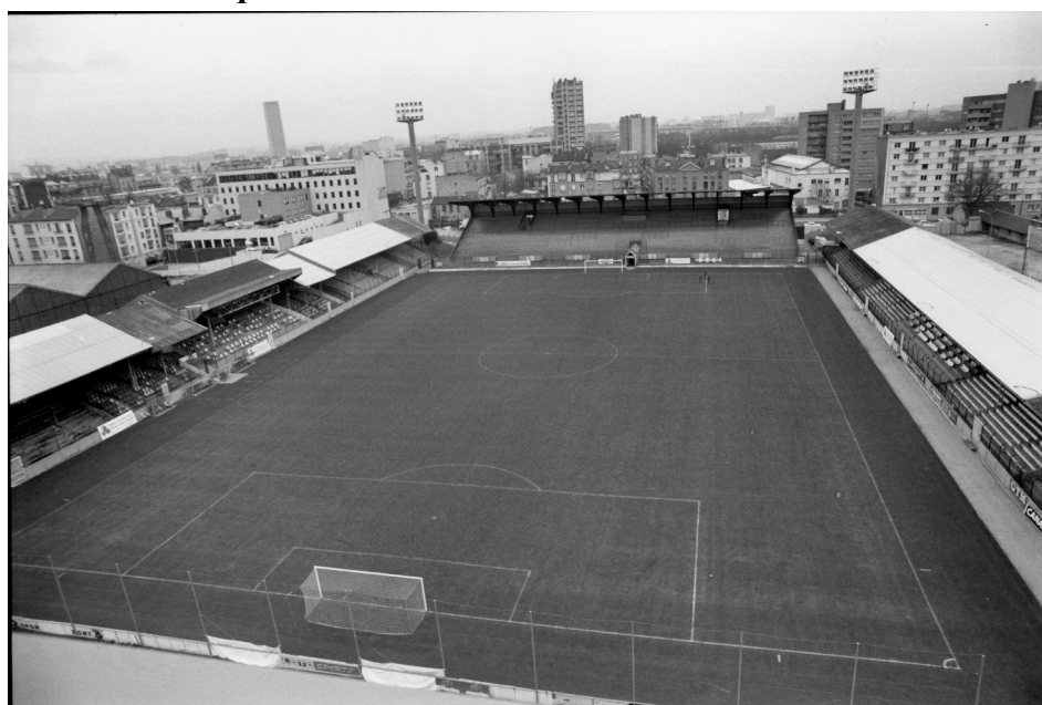
Figure 6. Vue générale du stade Bauer (ancien stade de Paris) en 1997 ; à gauche, la tribune historique