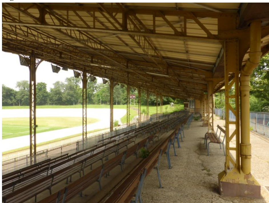
Figure 5. Les tribunes du vélodrome de Vincennes