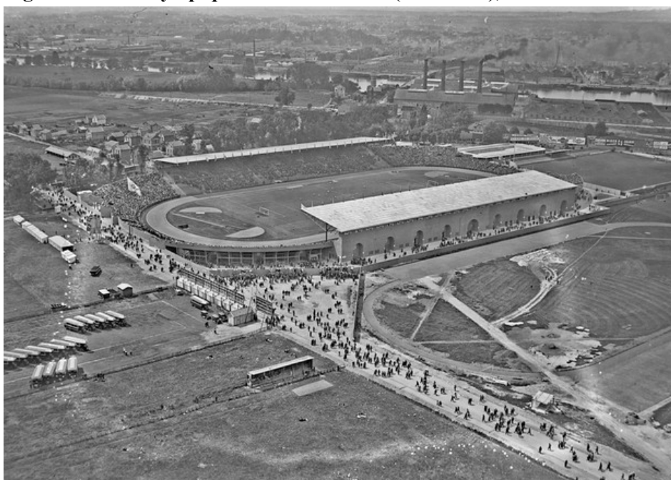
Figure 3. Stade olympique Yves-du-Manoir (Colombes), 1924