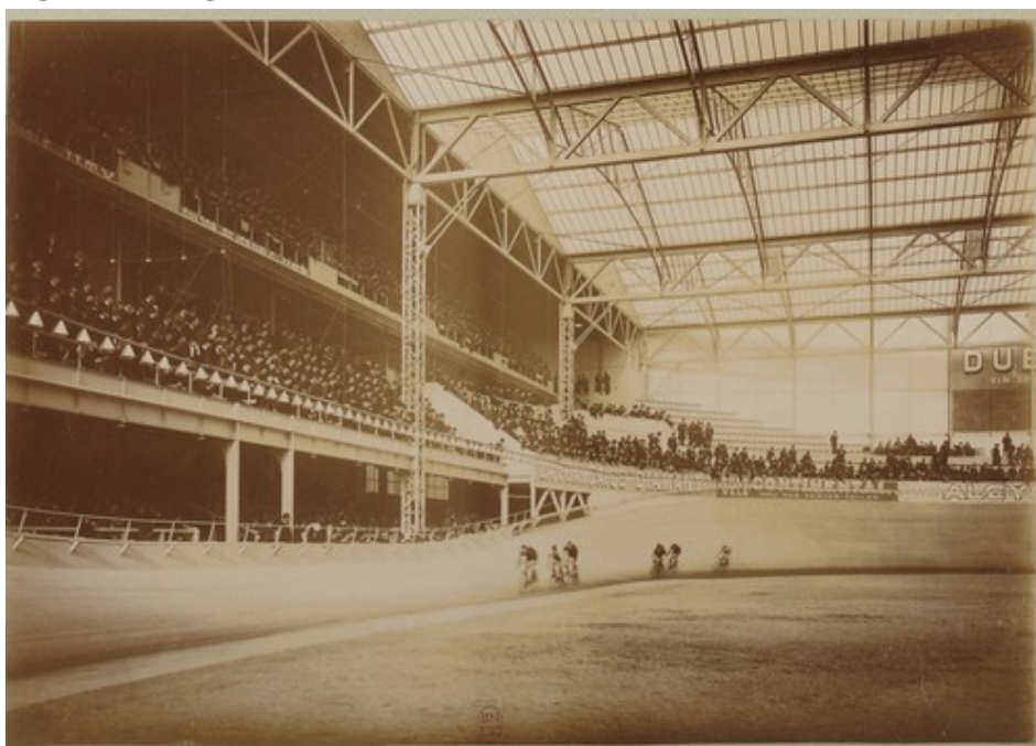
Figure 2. Inauguration du vélodrome d'Hiver le 13 février 1910