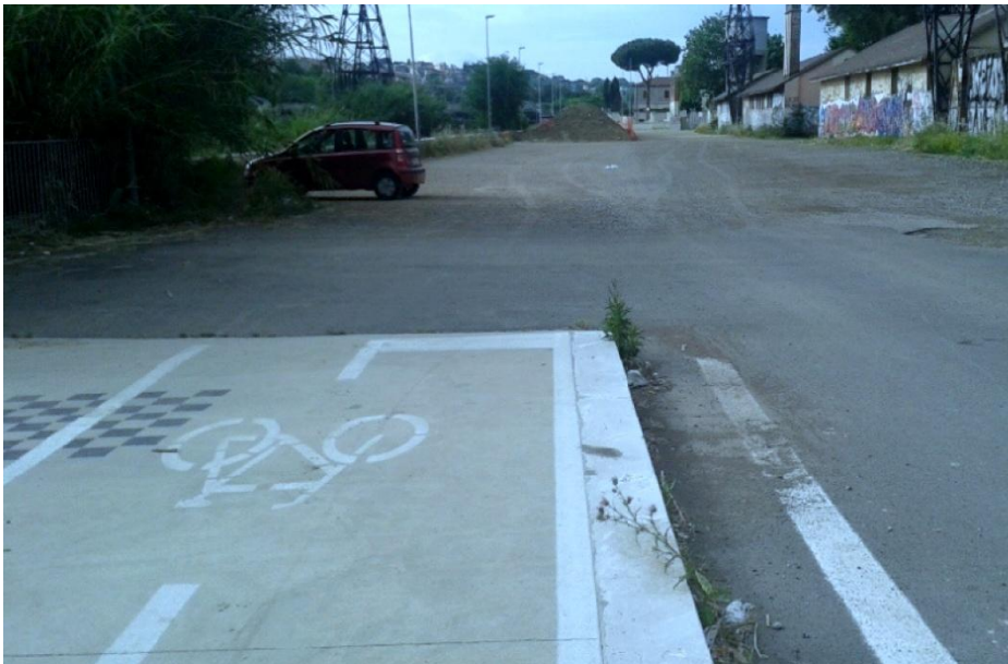
Figure 3. Aménagement urbain inachevé dans le quartier d'Ostiense (2015)