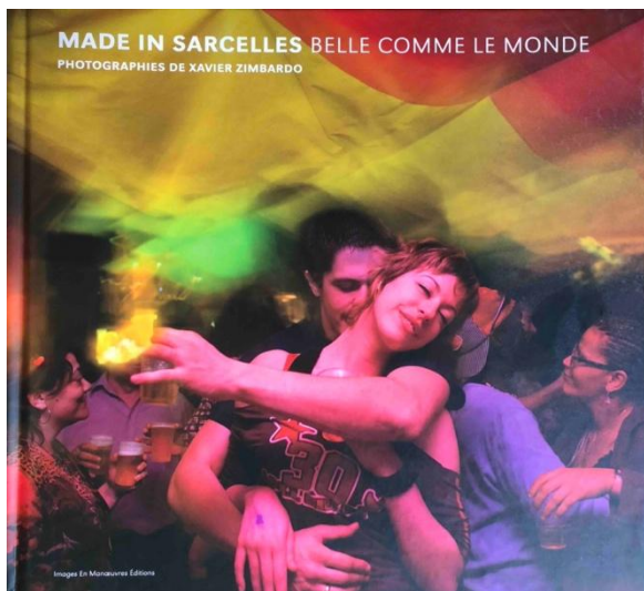
Figure 3. Couverture du livre de Xavier Zimbardo, Made in Sarcelles. Belle comme le monde , Marseille, Images en manœuvres, 2007.

Si ces productions visuelles contribuent à repenser l'image de la ville, d'autres citoyens y participent plus directement à travers des initiatives locales. Le Club des Belles Images (CBI) est l'un de ces collectifs locaux. Le CBI est fondé « en 1971 par des amoureux de la photographie [...] [qui] voulaient prouver qu'à Sarcelles, ville unanimement décriée car étant la première banlieue en France à compter des HLM, la culture et la passion pouvaient aussi fleurir parmi le béton 4 ». Les membres du club produisent diverses œuvres visuelles, mettant souvent en avant des récits sur la vie citadine, rendus publics lors d'expositions et dans leur magazine ( Belles Images Photographies ) 5 . Les sujets varient, allant des événements festifs locaux aux paysages, en passant par des portraits et l'actualité culturelle de la ville.