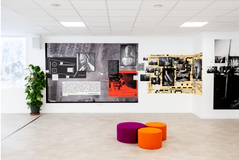
Figure 5. Exposition La Cité : une anthropologie photographique , médiathèque Anna-Langfus (Sarcelles, 2023)

appréciations de certaines personnes qui ont vu leur image exposée en grand format pour la première fois.