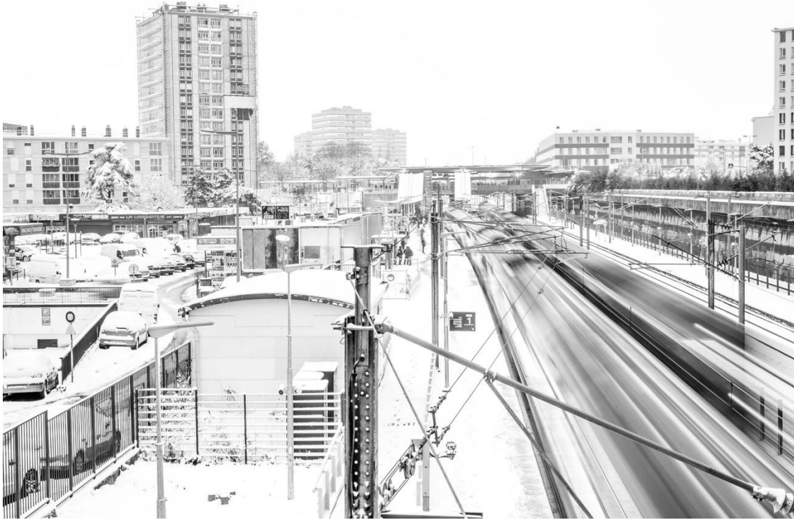
Figure 2. Gare de Sarcelles sous la neige (2018)