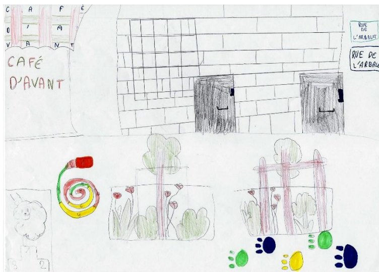
Figure 1. Dessins commentés d'Amélie (en haut) et de Mina-Sara (en bas)