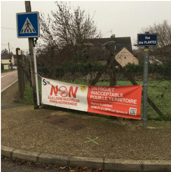
Figure 3. Commune du Breuil-Bois-Robert (Yvelines) : banderole contre le projet de LGV Paris-Normandie